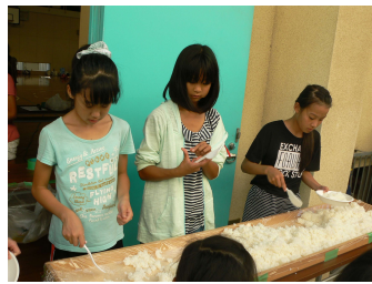
6年生によるご飯の配給