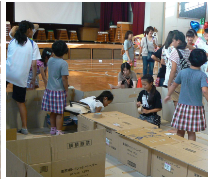
熱心に避難所設営するこども達