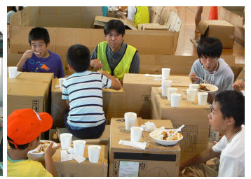
避難所でこども達と食事