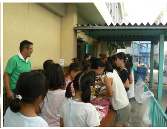
中学生によるカレーの配給