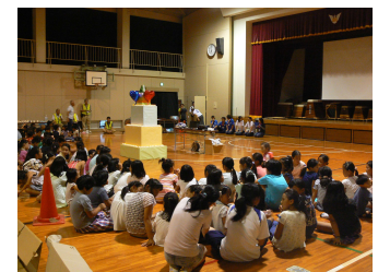
ライトタワーを取り囲む

夕食が終了した後、19時から約30分間イベントを開催。このイベントは、こども達の連帯感を高めることを目的として実施した。体育館の半分をイベント広場として設営し、その中央にライトタワーを設置。ライトタワーはダンボール箱で作成し、各段には小さなロウソク形のLEDライトを300個配置。イベントの開始時に全ての電気を消灯することで、イベント広場中央に設置されたライトタワーが綺麗に浮かび上がった。その時、こども達からは多くの歓声の声が上がり、感動的な場面を演出することができた。その後、全員で3曲の歌をうたい、まさに参加者全員がひとつになった瞬間である。