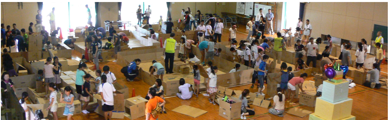
ダンボールでの避難所設営の様子

避難所完成後には、各チームの 6 年生リーダーより「どのような考えで避難所を作ったか」について発表してもらい、西濱氏がそれぞれそれぞれの避難所について講評を行った。