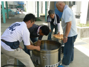
夕食の炊出し準備

アルファ米の炊出しとカレーの温めは、火傷などのリスクを配慮して大人の指導員が行った。炊き上がったご飯とカレーの配給は、中学生ボランティアと6年生の女子が担当した。食事は、自分たちが作った避難所で、みんなで美味しくいただいた。